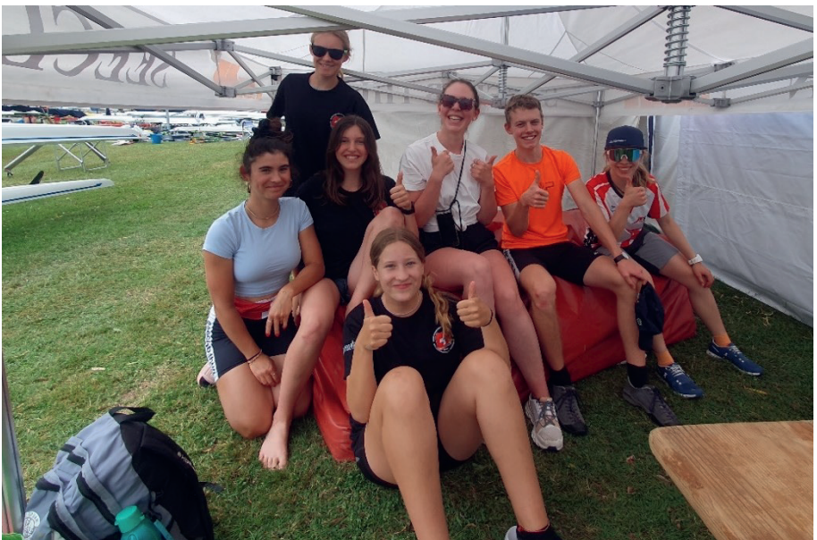
An den Schweizermeisterschaften