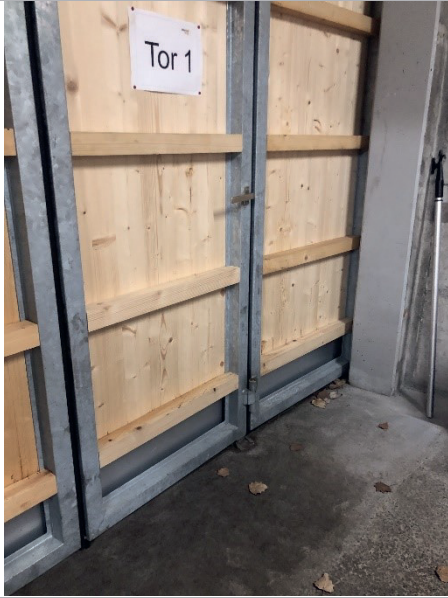
b) Von nah mit Verschlussnocke