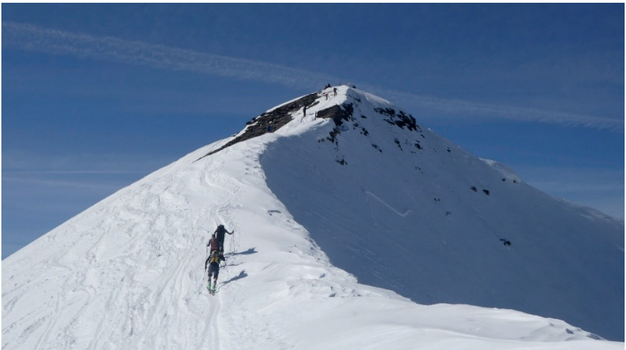
Im Gipfelaufschwung zum Ammertenspitz