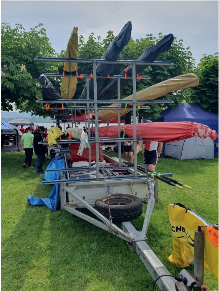
Auch für Reto gab es diese Saison mehr Boote zu transportieren als in den letzten Jahren.