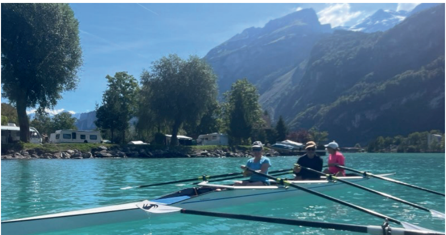
Kurze Rast bei Brienz. Die spezielle Farbe des Brienzersees fasziniert immer wieder.