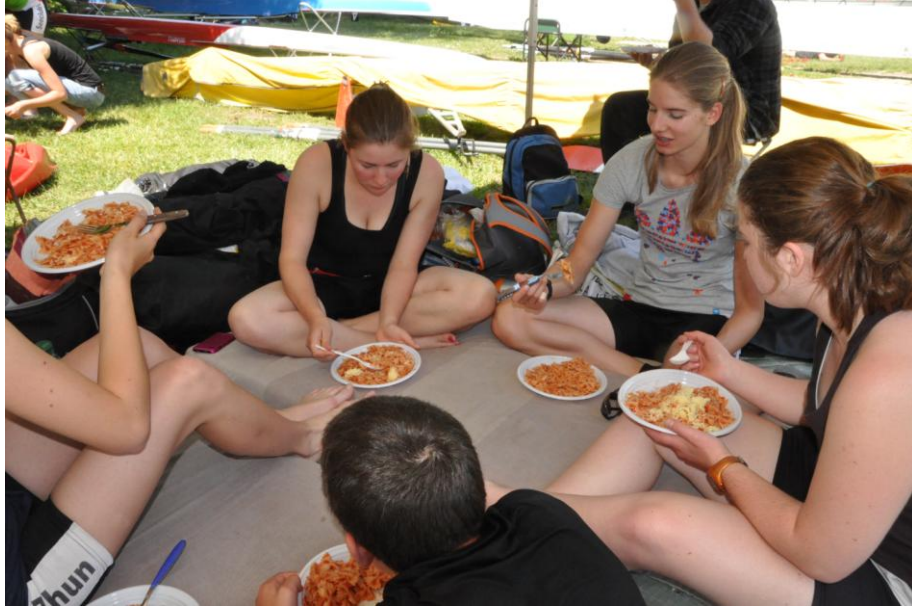
Lac d'Aiguebelette: Mmh...Pasta. Die beste Verpflegung für hungrige Sportlerinnen.