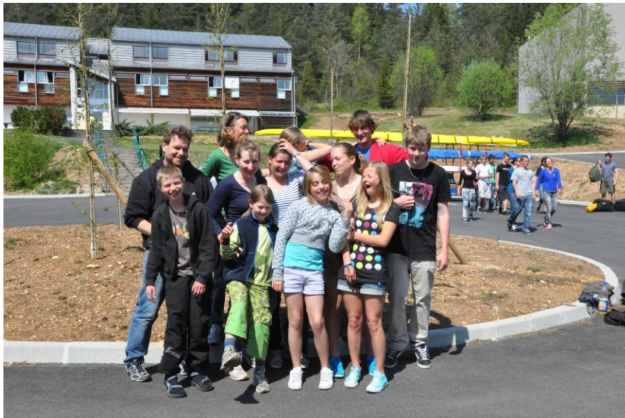
Trainingslager Bellecin (F, Jura): Das Regattateam des SCT inkl. Betreuerinnen und Fahrer.